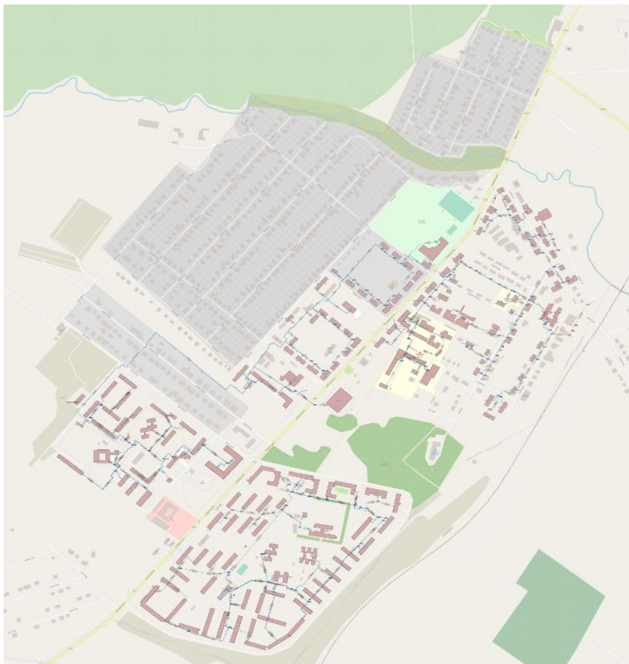
Рисунок 1 – Зоны действия индивидуального теплоснабжения на территории г.п. Комсомольский

Балансы существующей на базовый период схемы теплоснабжения тепловой мощности и перспективной тепловой нагрузки в каждой из зон действия источников тепловой энергии с определением резервов (дефицитов) существующей располагаемой тепловой мощности источников тепловой энергии, устанавливаемых на основании величины расчетной тепловой нагрузки приведены в таблице 6.