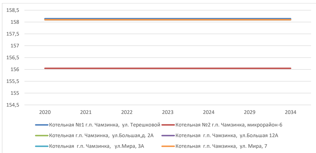
Рисунок 2. Динамика НУР топлива на период 2020-2034 г.г

Прогнозы по отпускаемой тепловой энергии и топливопотреблению рассматривались по котельным, которые задействованы в схеме теплоснабжения, со следующим допущением: производство тепловой энергии ведомственной котельной остаётся на уровне базового года. Перспективное значение удельных расходов топлива на производство тепловой энергии приведено на рисунке 2 и в таблице 17.