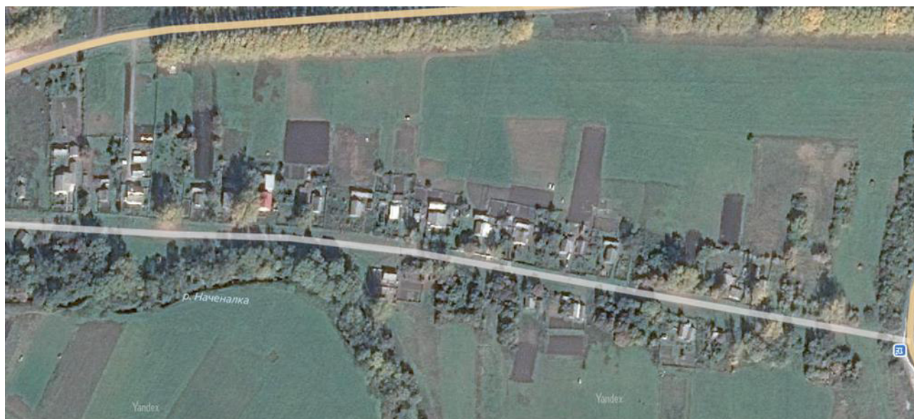
Рисунок 1 – Зоны действия индивидуального теплоснабжения на территории с. Апраксино.

Балансы существующей на базовый период схемы теплоснабжения тепловой мощности и перспективной тепловой нагрузки в каждой из зон действия источников тепловой энергии с определением резервов (дефицитов) существующей располагаемой тепловой мощности источников тепловой энергии, устанавливаемых на основании величины расчетной тепловой нагрузки приведены в таблице 6.