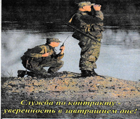
Служба по контракту - уверенность в завтрашнем дне!