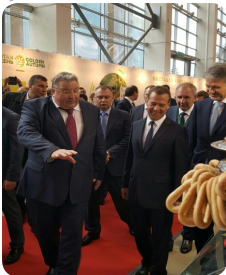
На фото: Председатель правительства РФ Дмитрий Анатольевич Медведев и делегация Республики Мордовия

В церемонии открытия главного аграрного мероприятия страны приняли участие Председатель Правительства РФ Дмитрий Медведев, министр сельского хозяйства РФ Александр Ткачев, а также представители профильных министерств и ведомств, главы регионов.