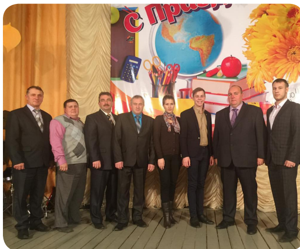
На фото: информационно - консультационная бригада Минсельхозпрода РМ в Ельниковском муниципальном районе Республики Мордовия

В ходе мероприятия школьники познакомились с Аграрным институтом МГУ им. Н. П. Огарёва, специально-