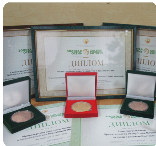
На фото: награды, полученные Министерством сельского хозяйства и продовольствия Республики Мордовия и мордовскими предприятиями пищевой и перерабатывающей промышленности

Министерство сельского хозяйства и продовольствия Республики Мордовия удостоено золотой медали за участие в конкурсе «За достижение высоких результатов в сфере устойчивого развития сельских территорий» и бронзовой медалью в номинации «Эффективная реализация региональных программ, направленных на устойчивое развитие сельских территорий».